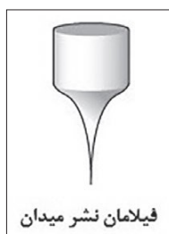
فیلامان نشر میدان

سرد ۱۳ م شناخته می‌شود، از یک تک بلور نوک بیز تنگستنی عنوان کاتد تشکیل شده‌است. در این نوع از تفنگ‌های الکترونی، الکترون‌ها با استفاده از اثر تونل‌زنی و با پشت سر گذاشتن سد انرژی در میدان الکتریکی قوی، منتشر می‌شوند. در شکل (۳) تصویر مربوط به فیلامان نشر میدان نشان داده شده‌است [۴ و ۳].